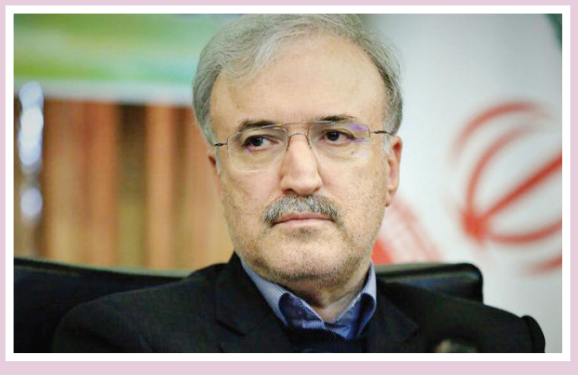
وزیر بهداشت در اینستاگرام نوشت: حالیا میز صدارت و صندلی وزارت اگر افتخار خدمتگزار می صادقانه مردم شریف سرزمینت در آن نباشد، از آب بینی بزی که...