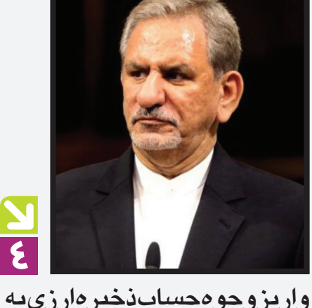
واریز و جو حساب ذخیره ارزی به حساب در آمد عمومی با ارز نیمایی