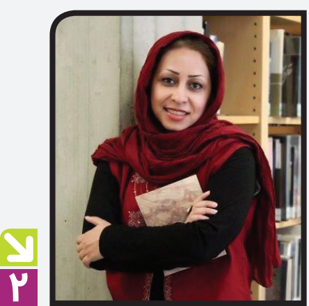
چیزهایی که ادبیات کودکان و نوجوان را تهدید می کند

گذاشت و مورا از ماست کشید. او افزود: البته این اتفاق دو سوبه است؛ از طرفی وقتی یک گروه اجرایی بازیگری می شود باید به آنچه متعهد شده اند، عمل کنند و این طبیعی است که وقتی گروهی شرایطی را می پذیرد باید طبق همان شرایط عمل کند. بنابراین تغییر و تحول خاصی نباید در روند نمایش پیش آید. البته ممکن است تغییرات جزئی اتفاق بیفتند اما این تغییرات نباید به گونه ای باشد که نیاز به بازیگری مجدد پیش آید. دلخواه اضافه کرد: از طرف دیگر زمانی که کاری بازیگری شده و مجوز گرفته و گروه طبق تعهدی که داده اند عمل می کنند، فرستادن افراد دیگر به اجرا و گزارش های مختلف، حساسیت های زیادی و غیرمنطقی است و احساس امنیت را از