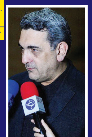
«البرز» پشت ساخت و ساز هاگم شده است

ظریف: وارثان تمدن کهن پارسی به توصیه خارجی ها تکیه نمی کنند