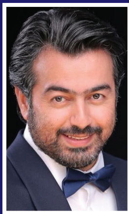
از دسترفوشی به خوانندگی رسیدم