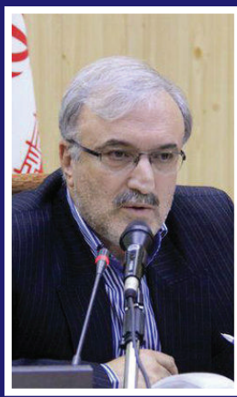
وزیر بهداشت: کمبود دارو و نخوایم داشت

فرمانده نیروی هوافضای سپاه پاسداران: در حوزه تسلیحات نظامی برای برداشتن تحریم‌ها التماس نکردیم