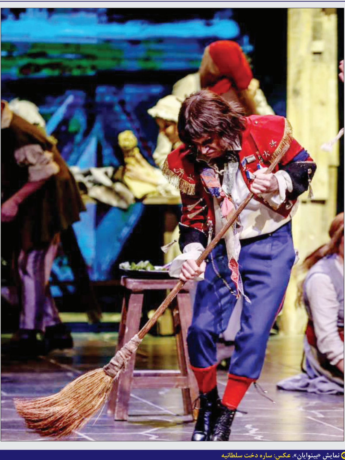
نمایش «بینویان»

منشور اخلاق حرفه‌ای روزنامه‌نگاری در سایت روزنامه