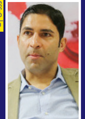
هاشمیان: بهترین است کی روش بماند