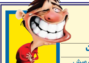
کات و مات نویسنده: کیش میش