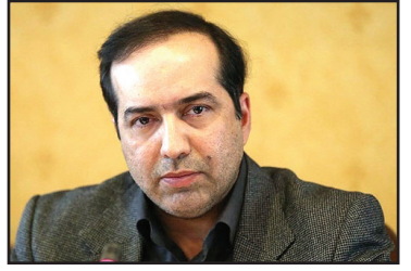
معاون مطبوعاتی خبر داد: اعلام روزانه تخلفات انتخاباتی رسانه‌ها به ستاد انتخابات