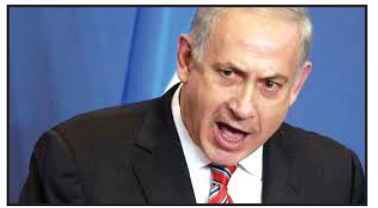
دوره‌گردی ضد ایرانی نتانیاهو