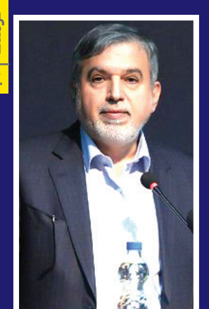
تقابل با فضای مجازی نتیجه نمی‌دهد