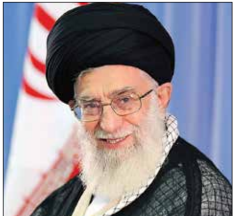
پیام تشکر رهبر انقلاب به کاروان ورزشی بازگشته از المپیک:

گروه ایران: تعدادی از فعالان شبکه اجتماعی که حوزه‌های ضدامنیت اخلاقی، چرخه مدلینگ مجرمانه و توهین به عقاید دینی مردم فعالیت می‌کردند، شناسایی و دستگیر شدند. به گزارش پایگاه اطلاع رسانی فرماندهی امنیت سایبری سپاه پاسداران انقلاب اسلامی، این اقدام در پی افزایش سطح مطالبات عمومی جامعه برای برخورد با مجرمان